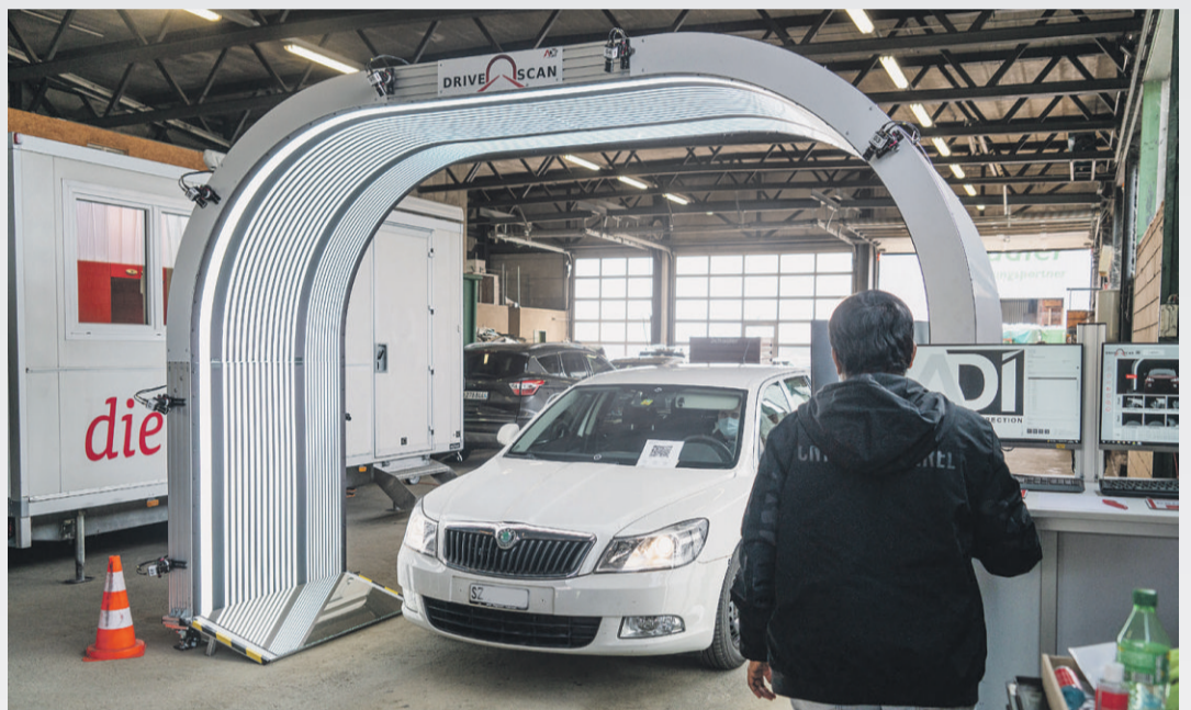
Der Besitzer dieses Skoda Octavias 4x4 TDI, der bereits ein paar Jahre auf dem Buckel hat und 240'000 Kilometer unter den Rädern, hat einen Totalschaden. Der geschätzte Wert des Autos liegt bei 5000 Franken. Mit Abzug des Restwertes (25 Prozent) erhält der Fahrer 3750 Franken.